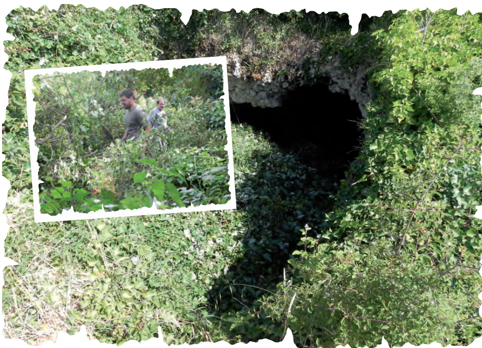
Débroussaillage en action.

Bien qu'indispensable sur les pourtours du front de taille, la végétation se développant aux entrées de la cavité peut gêner les chauves-souris dans leur déplacement. Pour contenir cette végétation, une action de débroussaillage est réalisée chaque année, en partenariat avec le Conservatoire Régional des Espaces Naturels (CREN), propriétaire du terrain où se situe l'entrée principale. Cette action permet également un ensoleillement direct de la carrière, favorisant l'accumulation de chaleur en sous-sol et permettant la reproduction des chauves-souris.