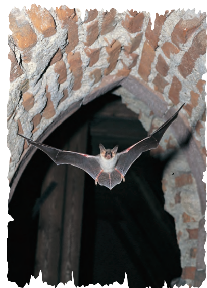
Grand murin