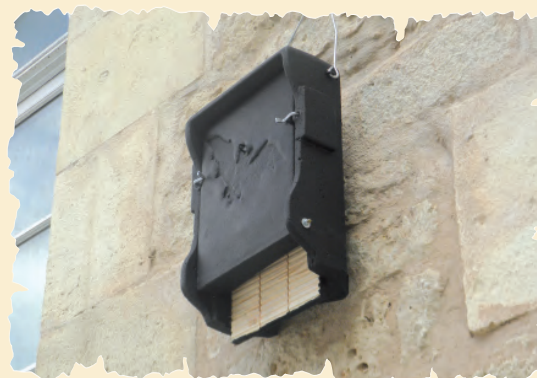
Gîte artificiel à chauve-souris.

LPO – Virginie BARRET : 05 46 82 12 34 ; lpo@lpo.fr