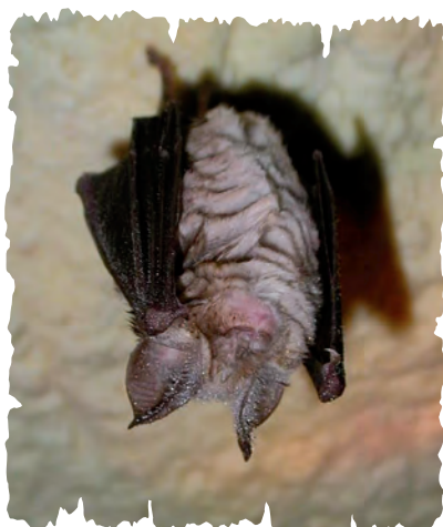
Rhinolophe euryale