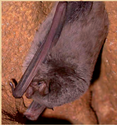
Miniopterus schreibersi