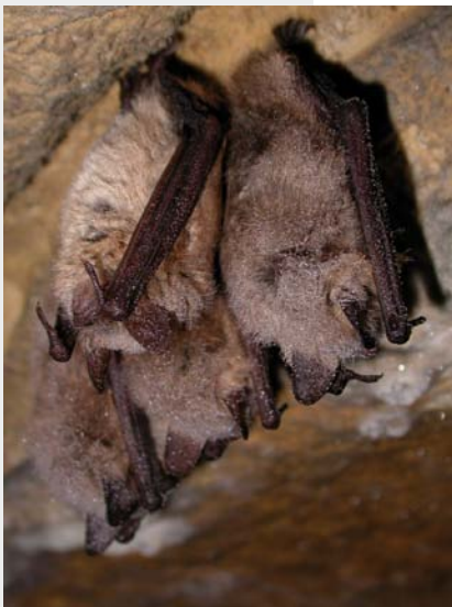
Murins à oreilles échanquées