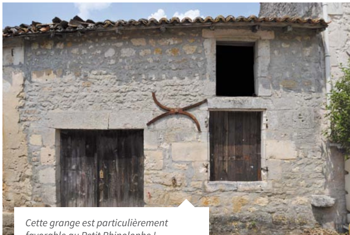
Cette grange est particulièrement favorable au Petit Rhinolophe !