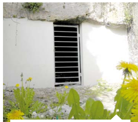
Fermeture d'entrées de cavité.