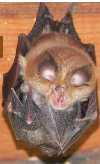
Femelle de Petit Rhinolophe et son jeune

Protégé en France, Annexe 2 et 4 de la directive européenne Habitat-Faune-Flore, Annexe 2 de la Convention de Berne.